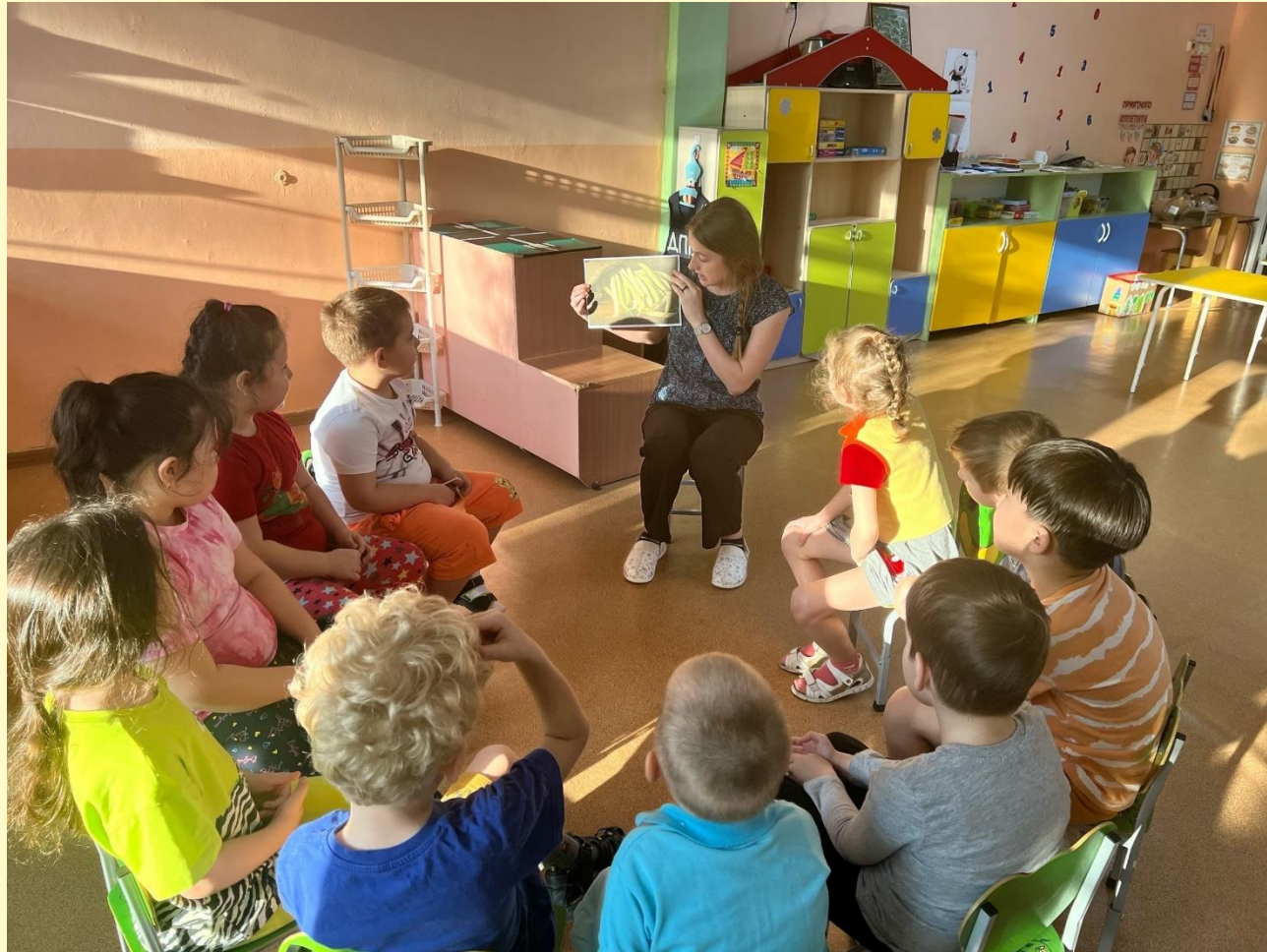
Беседа на тему «Фасоль»